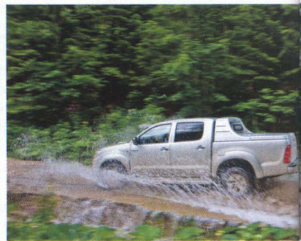
Tara je jedna od najlepših planina Srbije, pod gustim četinarskim i listopadnim šumama protkanim pašnjacima i livadama