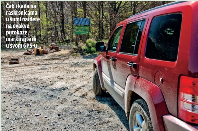
Čak i kada na raskrsnicama u šumi naidete na ovakve putokaze, markirajte ih u svom GPS-u

▶ Nemojte se previše oslanjati na automatsko rutiranje kod vektorske kartografije, ukoliko ga vaš uređaj podržava, a karta koju imate nudi. Greške u spojevima tačaka u pojedinim verzijama karte su moguće, pa tako i pokušaji automatskog rutiranja bizarnim i posve nelogičnim trasama. Ako mu i pribegnute, vizuelno prođite kroz celu trasu pre polaska i razmislite o logičnosti rutiranja. ▶ Koristite kartu prevashodno kao referencu za utvrđivanje svog položaja u prostoru, upoređujući ono što vidite na ekranu uređaja sa onim što vidite oko svog vozila.