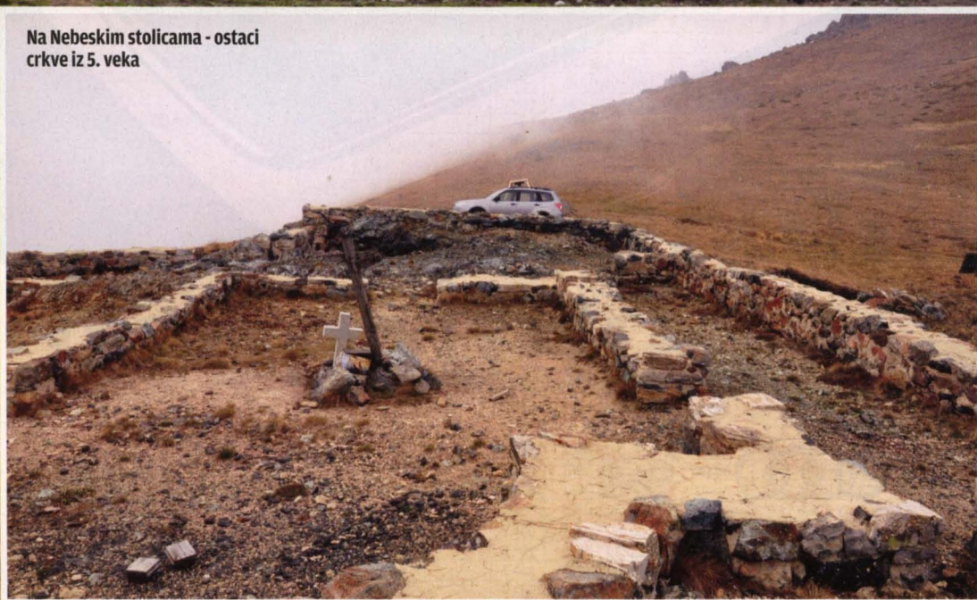
Na Nebeskim stolicama - ostaci crkve iz 5. veka