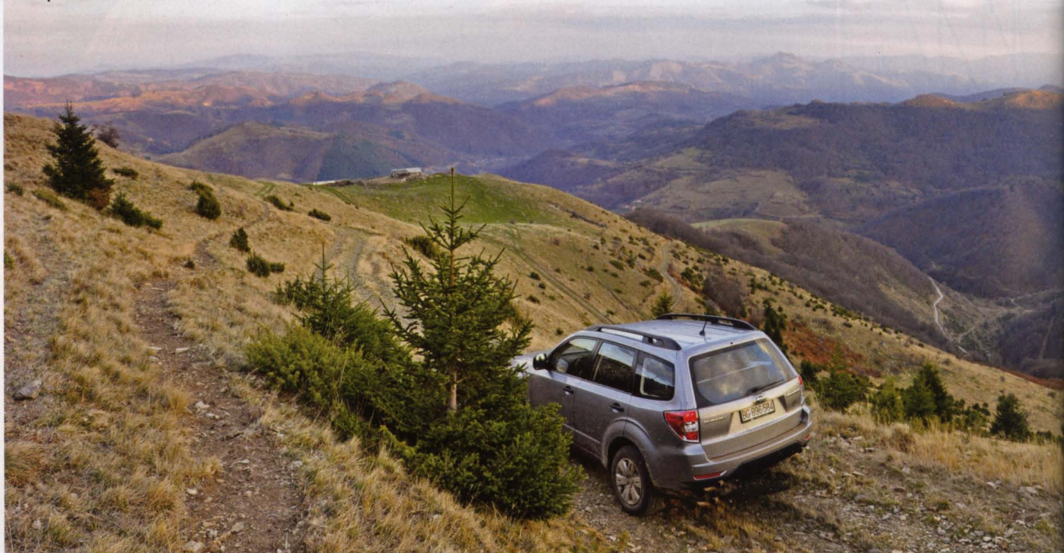
Serpentine i široki vidici

bolje, ali ćete jasno uočiti gde se on useca u četinarske drvorede. Dolazi vreme za vidike, pri čemu ćete s desne strane imati u vidokrugu vrhove Vučak i Kukavicu, a sa svakim kilometrom koji osvojite pred sobom ćete sve jasnije videti najviše vrhove Kopaonika. Prvi među njima je Pančičev vrh koji se nalazi na visini od 2.017 m, a prepoznaje se po okrugloj beloj kupoli radara.