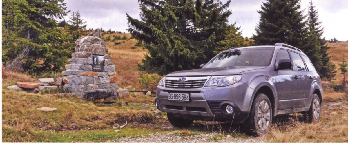
Likina česma u blizini Mekih presedla

veštinu i tip 4x4 vozila koje poseduje. Biće to prilika da prođete Kopaonik sporednim putevima (od čega je bar polovina van asfalta) i u krajnje raznovrsnom itinereru spojite većinu prirodnih i kulturnih znamenitosti koje turisti na tom prostoru obično posećuju. Videćete i neka poznata izletišta, neke tihe kutke poznate samo onima koji se odvažuju na ozbiljnije udaljavanje od civilizacije, ali i ostatke crkve iz