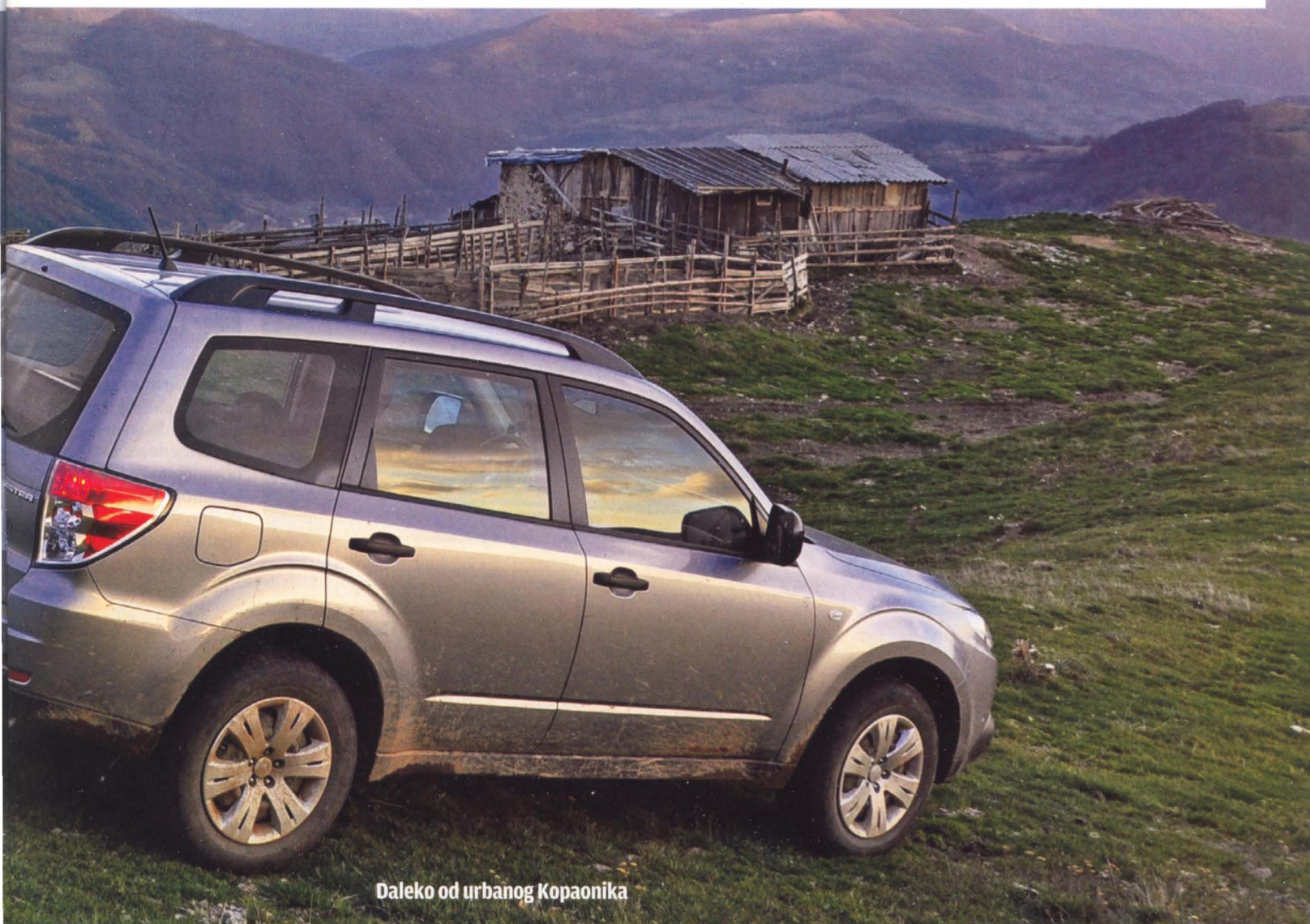
Daleko od urbanog Kopaonika

gotovo neprimetno dobijajući visinu, početi da izbijate na proplanke zapadnih padina Gobelje, prolazeći pored Rvatskih bačija do Mekih presedla. Nemojte da propustite priliku da zastanete na trenutak i natočite izvorsku vodu na Likinoj česmi, koju ćete videti na 16. kilometru puta, s desne strane. Na Mekim presedlima, posle 17,1 km puta, okrećete oštro desno, pri čemu se u prvi mah na livadi put i ne vidi baš naj-