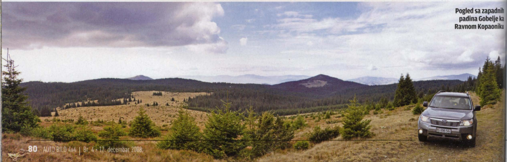
Pogled sa zapadnih padina Gobelje ka Ravnom Kopaoniku

Od Bele reke put vas dalje vodi vrhom glavnog grebena Kopaonika, preko Karamana do prevoja Pajino preslo, gde se razdvaja put obroncima Pančičevog vrha od onoga koji se spušta u dolinu Duboke. Vi nastavljate putem koji se lagano