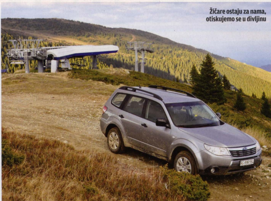
Žičare ostaju za nama, otiskujemo se u divljinu

Put obroncima Gobelje izvešće vas na Jaram, skijašima dobro poznato čvorište staza, gde ćete preseći i asfalt. Od Jarma hvatate donji put, koji ulazi u šumu ispod žičare Karaman. Ovo je jedna kratka, ali atraktivna vožnja solidno prosečnim šumskim putem, na