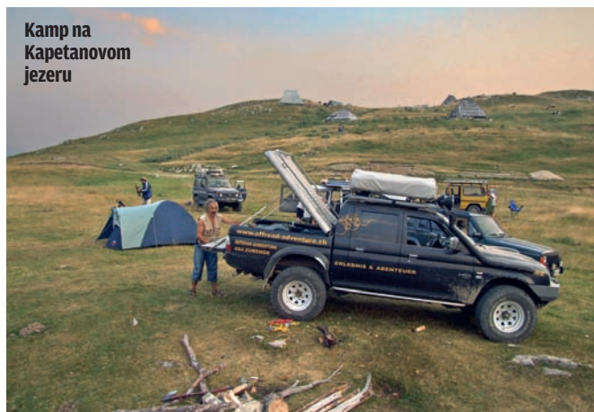
Kamp na Kapetanovom jezeru