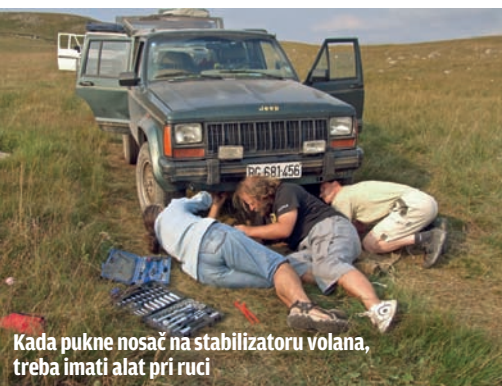
Kada pukne nosač na stabilizatoru volana, treba imati alat pri ruci