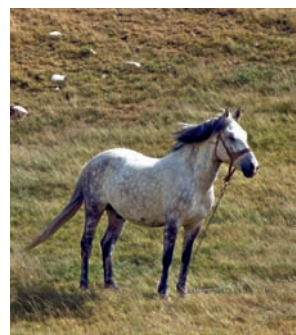
Jedino prevozno sredstvo koje prolazi svuda

gde se prema Morači završava stenovitim grebenom Babinog Zuba i Umova, kao i na severoistoku, na šumovitim padinama prema kanjonu Tare, potpuno drugačijim od ostatka planine.