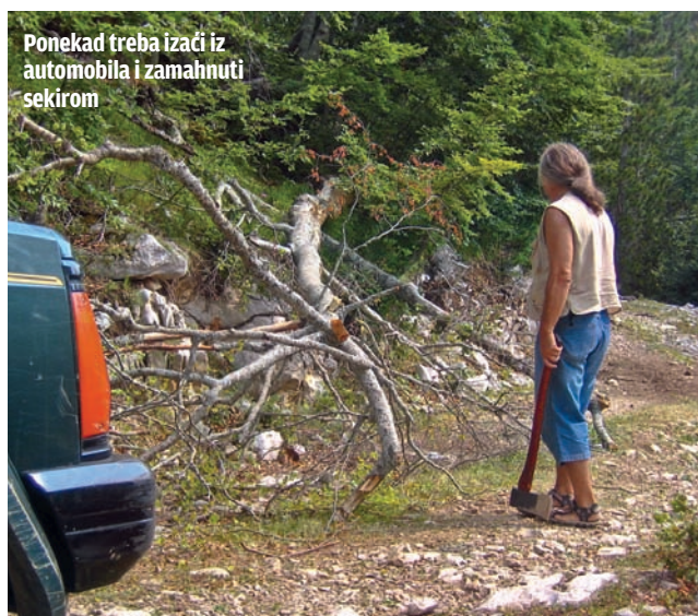
Ponekad treba izaći iz automobila i zamahnuti sekírom

K ada me je vlasnik agencije „Offroad Adventure“, iz Ciriha, specijalizovane za organizaciju 4x4 avantura, pitao da li mogu za njegove klijente da osmislim sedmodnevnu turu kroz najljucije crnogorske kamenjare, nisam se mnogo dvoumio, jer taj fascinantni prostor odlično poznajem. Ali, trebalo je biti na visini zadatka i klijenteli naviknutoj na egzotiku pustinskih dina Sahare (hit destinacija u ponudi „Offroad Adventure“) priuštiti jednaku divljinu, pustolovinu i neizvesnost, ali u srcu Evrope. Pitao sam samo gde i kada grupa ulazi u Crnu Goru, nakon čega je 600 km duga pustolovi-