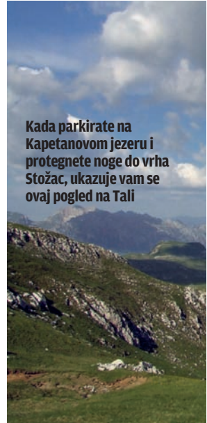
Kada parkirate na Kapetanovom jezeru i protegnete noge do vrha Stožac, ukazuje vam se ovaj pogled na Tali

ganika, po tim blokovima, iz kamenih pukotina rastu borovi, dok su sami vrhovi – Mededi, Trešteni, Kokotovi i ostali – potpuno goli, predstavljajući jedan neverovatan kameni lavirint u kojem pešak vrlo lako može da se izgubi. Vode ima samo u katunima Maganika, Poljana i Vragodo, i na još nekoliko česama duž puta kojim, pored konja i ovaca, retko kada prođe bilo šta na točkovima. Odmakavši četrdesetak kilometara od Nikšića, usred ničega, naš konvoj je konačno došao u priliku da se opusti i da, prvi put na ovom proputovanju, opuštenu podigne svoj logor, bez straha da bi mogao da se pojavi neko ko bi im skrenuo pažnju da ne mogu tu da ostanu.