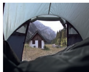
Buđenje u šatoru na dnu kanjona Sušice

Prešavši Lolu i Semolj, stigli smo konačno i do Sinjajevine, najveće krševite visoravni u Crnoj Gori i planine koja zauzima najveću površinu od svih crnogorskih planina. Sinjajevina je jedno ogromno, zatalasano prostranstvo kamena i trave, iz kojeg tu i тамо stidljivo izviruje poneko uzvišenje, preko koga ne postoji puno puteva. Jedino što ćete na tih pedesetak kilometara susresti jesu sporadični katuni, od kojih je tek poneki naseljen. Dramatičniji reljef na Sinjajevini susrećete samo na njenom krajnjem jugu,