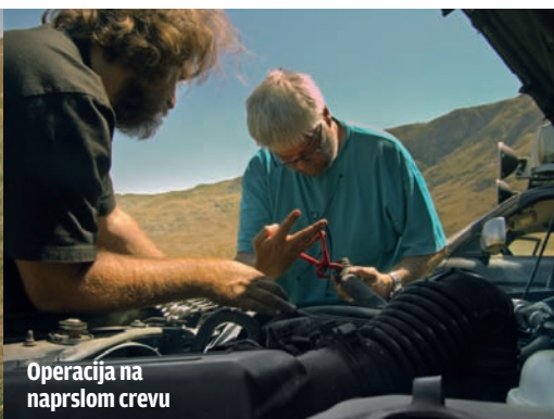
Operacija na naprsnom crevu