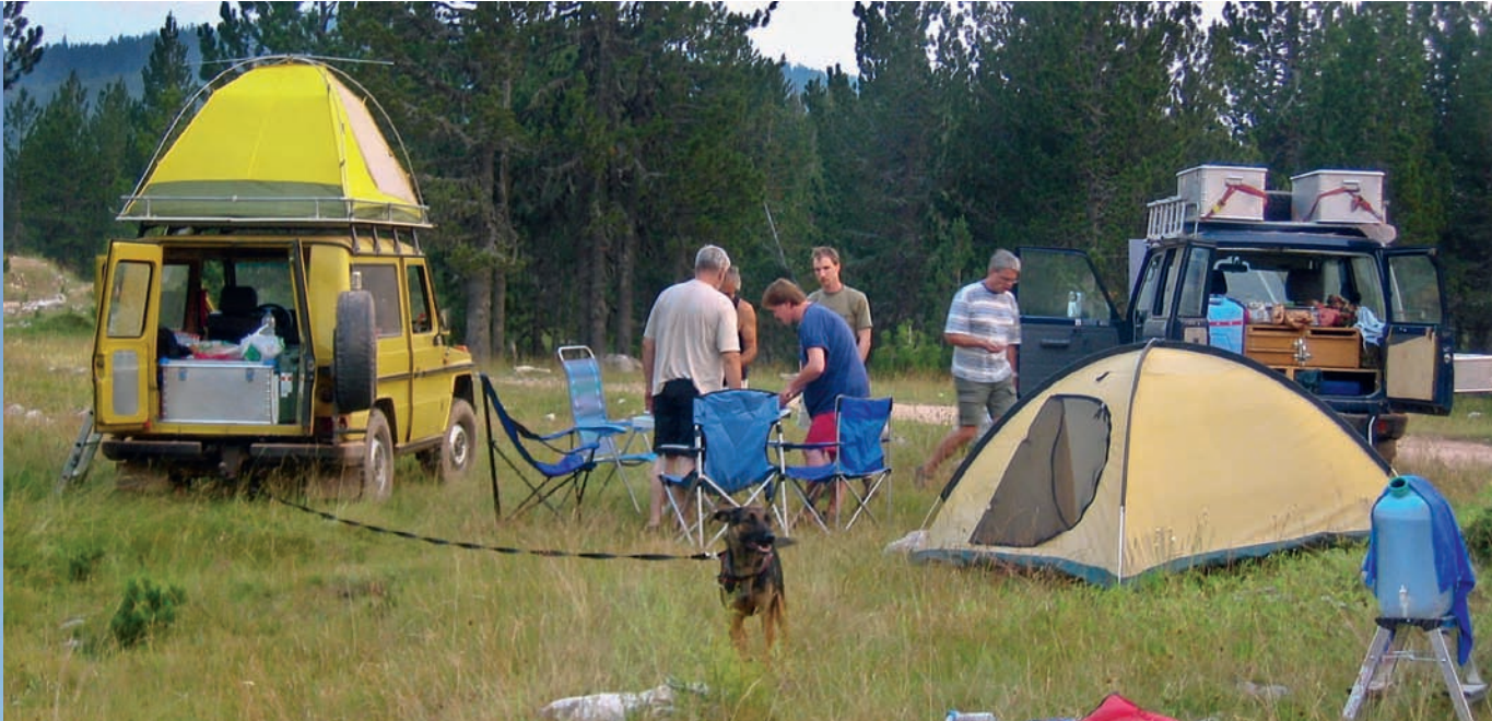
Sve je tu: nije nam potrebna nikakva turistička infrastruktura