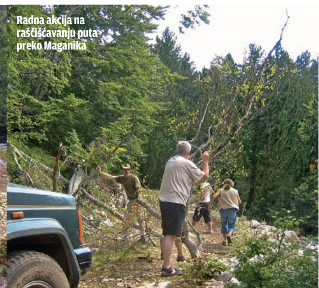
Radna akcija na raščišćavanju puta preko Maganika