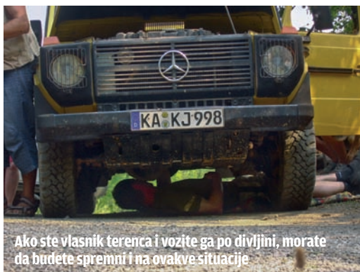
Ako ste vlasnik terenca i vozite ga po divljini, morate da budete spremni i na ovakve situacije

Stigavši u Žabljak, pred kraj četvrtog dana probijanja kroz crnogorske vrleti, ponovo smo videli civilizaciju, ali to nije bilo ono čemu smo težili – bila je to samo prilika da se napune ispražnjeni rezervoari i obnove zalihe svežih namirnica, nakon čega smo brže-bolje krenuli u veliki krug oko Durmitorskog masiva, preko kanjona Sušice i Trse,