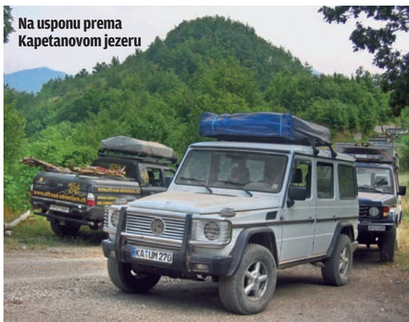
Na usponu prema Kapetanovom jezeru