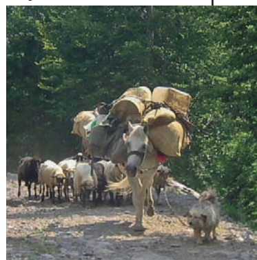
Transport namirnica preko Maganika uglavnom se obavlja ovako