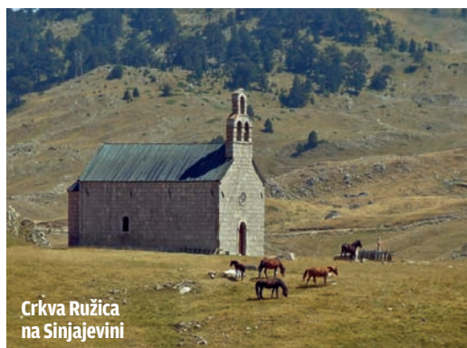
Crkva Ružica na Sinjajevini

” Zaista je teško održati 'saobraćajni optimizam', ali moramo da počnemo nekako da menjamo sebe, a samim tim i situaciju. ”