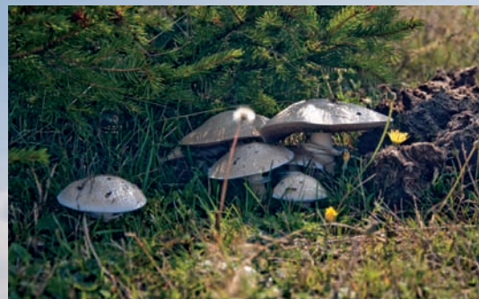
Livadskih šampinjona na Beljanici ima posvuda

Na samo 150 km od Beograda, u srcu Homolja, nalazi se planina Beljanica: ogromno prostranstvo kojim caruju vukovi i čija je visoravan jedna od poslednjih oaza za divlje konje u Srbiji. Beljanica je i savršeno mesto za živopisnu vožnju vašeg 4x4 ljubimca, a uz malo više opreza, na sam vrh planine može da se izađe i putničkim automobilom! Mi smo za vas pripremili vodič za prelazak Beljanice sa dva opciona kraka, koji može da zadovolji sve želje i ukuse