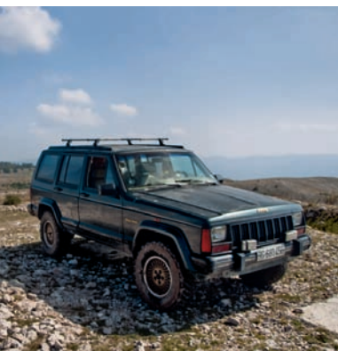
Put vodi do samog vrha Beljanice

Na samu Beljanicu ponesite sa sobom sve što vam je potrebno, jer gore nećete naći apsolutno nikakvu turističku infrastrukturu. Ali ako poželite da ručate nakon što sidete sa planine, ili čak da prenoćite, na raspolaganju vam je više objekata koji mogu da se preporučite. Na samom Krupajskom vrelu, gde se naša trasa završava, u letnjoj sezoni, pored bazena sa termalnom vodom, radi restoran u kojem može da se dobije pastrmka iz obližnjeg ribnjaka. U neposrednoj blizini, nakon što se vratite do asfaltnog puta i krenete na sever u smeru Krepoljina, nekoliko stotina metara dalje naići ćete na restoran „Zov Homolja“, gde vas očekuje širi izbor jela domaće kuhinje. Odlučite li da još malo pronjuškate po Žagubičkoj kotlini i da se nakon kruga po Beljanici od Krepoljina uputite ponovo ka Žagubici umesto ka Beogradu, na četiri kilometra pre Žagubice, kod Trške crkve (inače najstarijeg sakralnog spomenika u Braničevskoj eparhiji), videćete tablu koja vas upućuje u „etnoselo Trška“ – ovo mesto svakako ne treba propustiti, jer ćete, pored vlaških specijaliteta, moći da uživete i u jedinstvenom, rustičnom ambijentu. Od proleća 2010. godine u okviru etnosela počće da rade i vajtati i kamp, tako da će moći da se dobije i smeštaj. Naravno, smeštaj i hranu, takođe, možete da dobijete u motelu „Vrelo Mlave“, koji se nalazi u Žagubici, pored samog vrela Mlave (100 metara od tačke gde počinje naš radar).