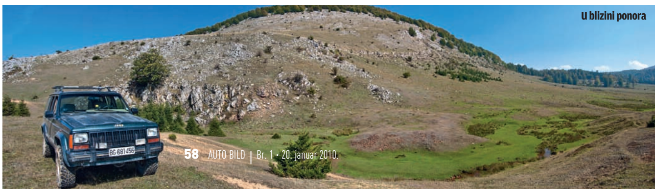
U blizini ponora

Trasa koju smo za vas pripremili otpočinje nadomak vrela Mlave na južnoj periferiji Žagubice, na mestu gde se račva put ka planini koji prolazi oko groblja, i prilazni put za motel „Vrelo Mlave“. Dakle, to je tačka na kojoj treba da poništite brojač kilometra-