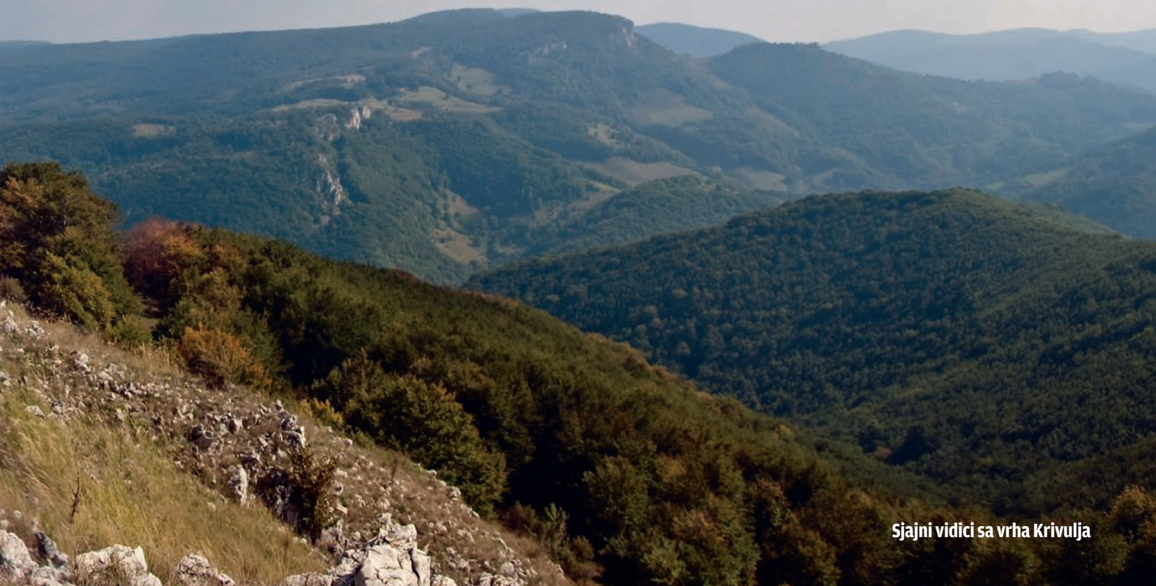
Sjajni vidici sa vrha Krivulja

že i da počnete pažljivo da pratite priloženi, 62,5 km dug radar. Trasa nije komplikovana za navigaciju jer vas, zapravo, sve vreme vodi glavnim putem preko planine. Znači, čak i da nije priložen detaljan radar, da ne biste zalutali potrebno je samo da na svakom račvanju pratite onaj put koji vam se čini kao glavni.