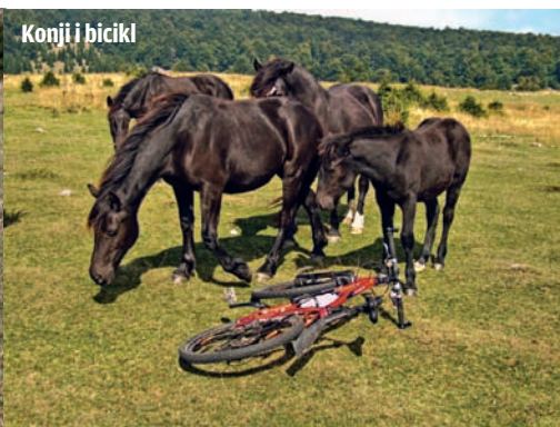
Konji i bicikl