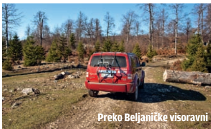
Preko Beljaničke visoravni