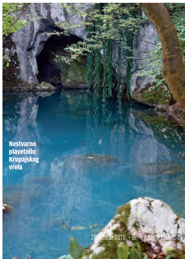
Nestvarno plavetnilo Krupajskog vrela

štajući se ka selu Sladaja i asfaltu Despotovac – Krepoljin, već je malo zahtevniji, i njega ne bismo preporučili vlasnicima putničkih automobila, ali još uvek nije problematičan ni za „lakša“ SUV vozila sa standardnim pneumaticima i bez blokada ili povišenog klirensa. Ono što bi na toj deonici puta moglo ponajviše da vas iritira jeste činjenica da je u završnom delu nasut dosta debelim slojem grubog, izrazito krupnog šljunka (možda bi tačnije bilo reći – sitnog ka-